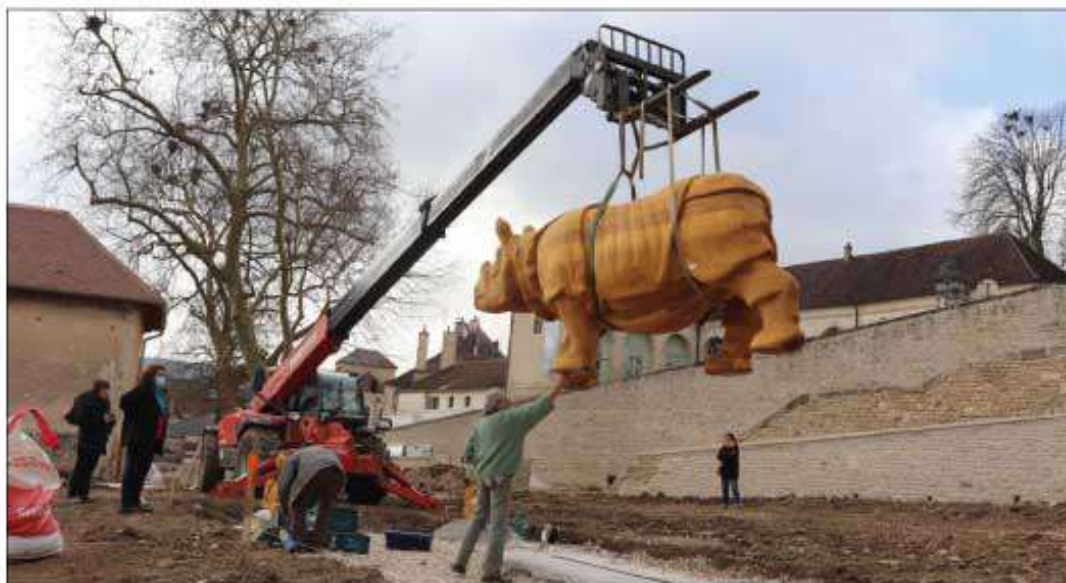
Le rhinocéros monumental est resté suspendu dans les airs quelques minutes, le temps de préparer le socle sur lequel il sera installé.